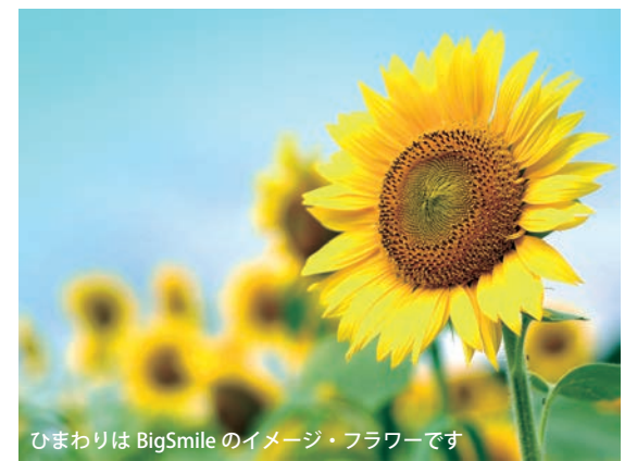
ひまわりはBigSmileのイメージ・フラワーです