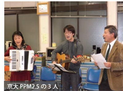
京大 PPM2.5 の 3 人