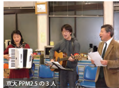
京大 PPM2.5 の 3 人