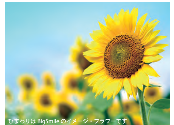
ひまわりは BigSmile のイメージ・フラワーです