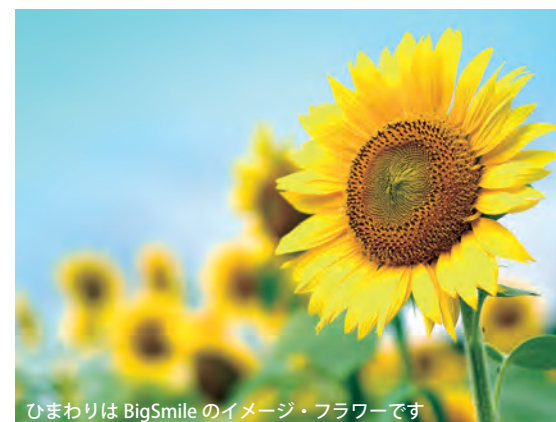
ひまわりは BigSmile のイメージ・フラワーです

ご利用の詳細については、職員組合のWebサイトをご覧ください。 https://www.kyodai-union.gr.jp/ スマートフォン用QRコード→