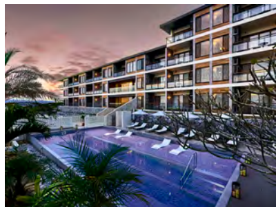
BATON SUITE 沖縄古宇利島（外観）