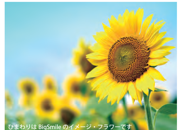
ひまわりは BigSmile のイメージ・フラワーです

ご相談を希望される方は、組合事務所にお問合せいただければ、契約カウンセラーとの相談日時を調整いたします。