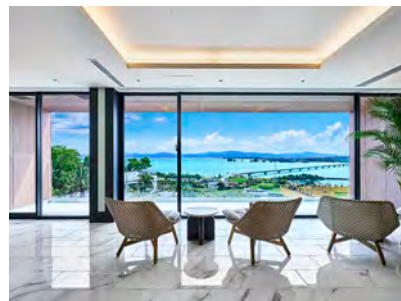
BATON SUITE 沖縄古宇利島（ロビー）